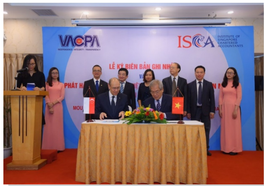
Lễ ký Biên bản thỏa thuận giữa VACPA và ISCA về dịch và phát hành sách “Chương trình kiểm toán mẫu – Báo cáo tài chính Singapore”.

Ngày 25/10/2019, tại Hà Nội, VACPA đã tổ chức Lễ ký biên bản thỏa thuận với Viện Kế toán công chứng Singapore (ISCA) về dịch và phát hành sách “Chương trình kiểm toán mẫu - Báo cáo tài chính Singapore”, trao tặng và giới thiệu nội dung sách cho cơ quan Nhà nước, Hội viên tổ chức của VACPA.