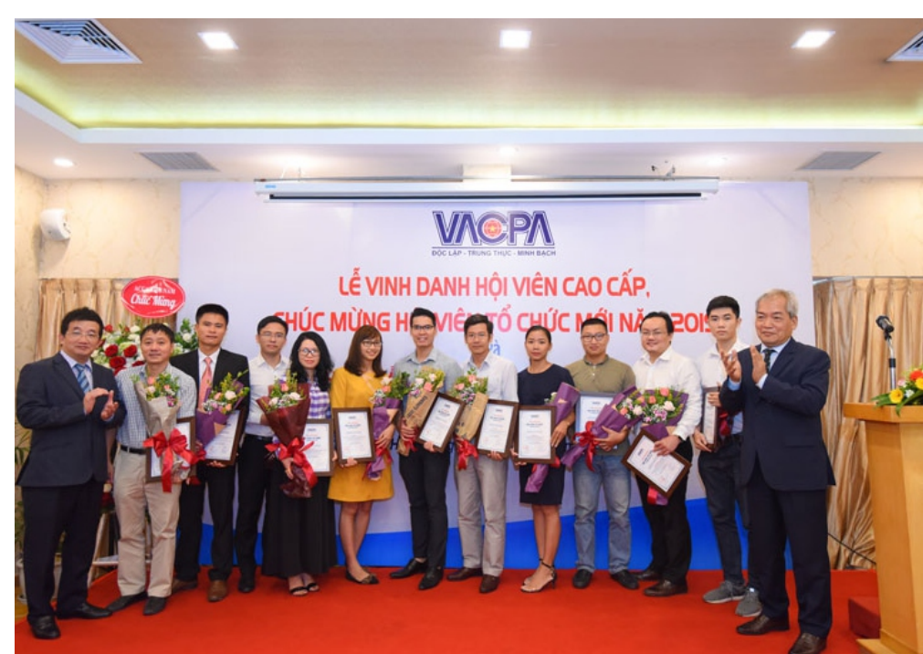
Hội viên tổ chức mới gia nhập năm 2019

VACPA tin tưởng rằng, với đội ngũ Hội viên ngày càng gia tăng về chất lượng cũng như số lượng, mỗi Hội viên cao cấp của Hội tự hào về vinh dự to lớn này, đồng thời cũng nhận thức được trách nhiệm rất nặng nề với vai trò nòng cốt, đi đầu trong mọi hoạt động, đóng góp có hiệu quả vào sự phát triển của nghề nghiệp trong tương lai. Hội Kiểm toán viên hành nghề Việt Nam sẽ tiếp tục vững bước trong giai đoạn mới, đạt được nhiều thành công hơn nữa, đóng góp tích cực và hiệu quả thực hiện các mục tiêu phát triển kinh tế - xã hội của nước nhà.