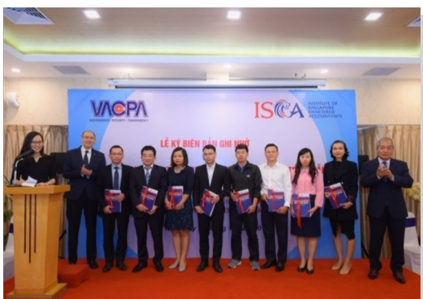
Lãnh đạo 2 Hội trao tặng sách cho cơ quan quản lý nhà nước và Hội viên VACPA