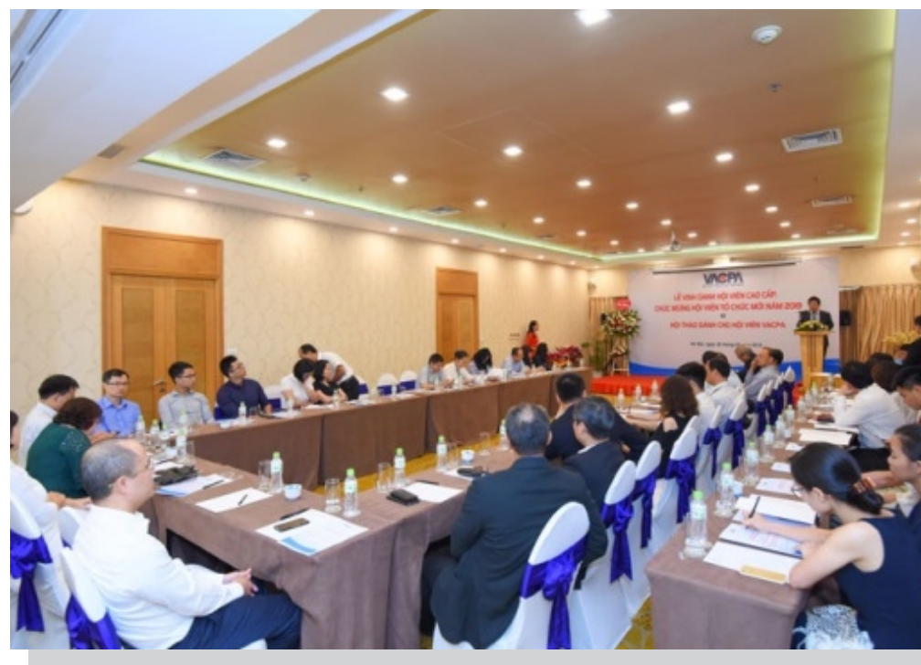
Toàn cảnh buổi Lễ

Phát biểu tại buổi lễ, Ông Phạm Sỹ Danh - Chủ tịch VACPA cho biết, trong suốt thời gian qua, VACPA đã phát huy tối đa vai trò của một hội nghề nghiệp chuyên nghiệp, hoạt động theo đúng phương châm “Nâng cao chất lượng dịch vụ, uy tín của Hội viên và hoạt động vì lợi ích của Hội viên”. Kết quả hoạt động của VACPA góp phần quan trọng trong việc công khai minh bạch thông tin tài chính, phục vụ cộng đồng doanh nghiệp, các nhà đầu tư trong và ngoài nước, cơ quan nhà nước cũng như tất cả các hoạt động kinh tế - xã hội của đất nước. Việc tổ chức Lễ vinh danh Hội viên cao cấp thường niên chính là để tri ân những công hiến, đóng góp của Hội viên cao cấp cho sự phát triển và hội nhập nhanh chóng, bền vững cùng khu vực và quốc tế của ngành Kiểm toán độc lập Việt Nam và cho sự phát triển của Hội Kiểm toán viên hành nghề Việt Nam, ngôi nhà chung của các kiểm toán viên và những người hoạt động trong lĩnh vực kiểm toán cả nước. Ông Danh cũng đã nhấn mạnh rằng, “Hội viên cao cấp” không chỉ là sự tôn vinh cho một danh hiệu cao quý của Hội nghề nghiệp, mà còn là sự ghi nhận, trân trọng và mong muốn các Hội viên luôn gìn giữ danh hiệu và phẩm chất, đạo đức nghề nghiệp độc lập, chính trực, khách quan, liêm chính, có khả năng đổi mới và sáng tạo trong tổ chức quản lý và thực hành nghề nghiệp.