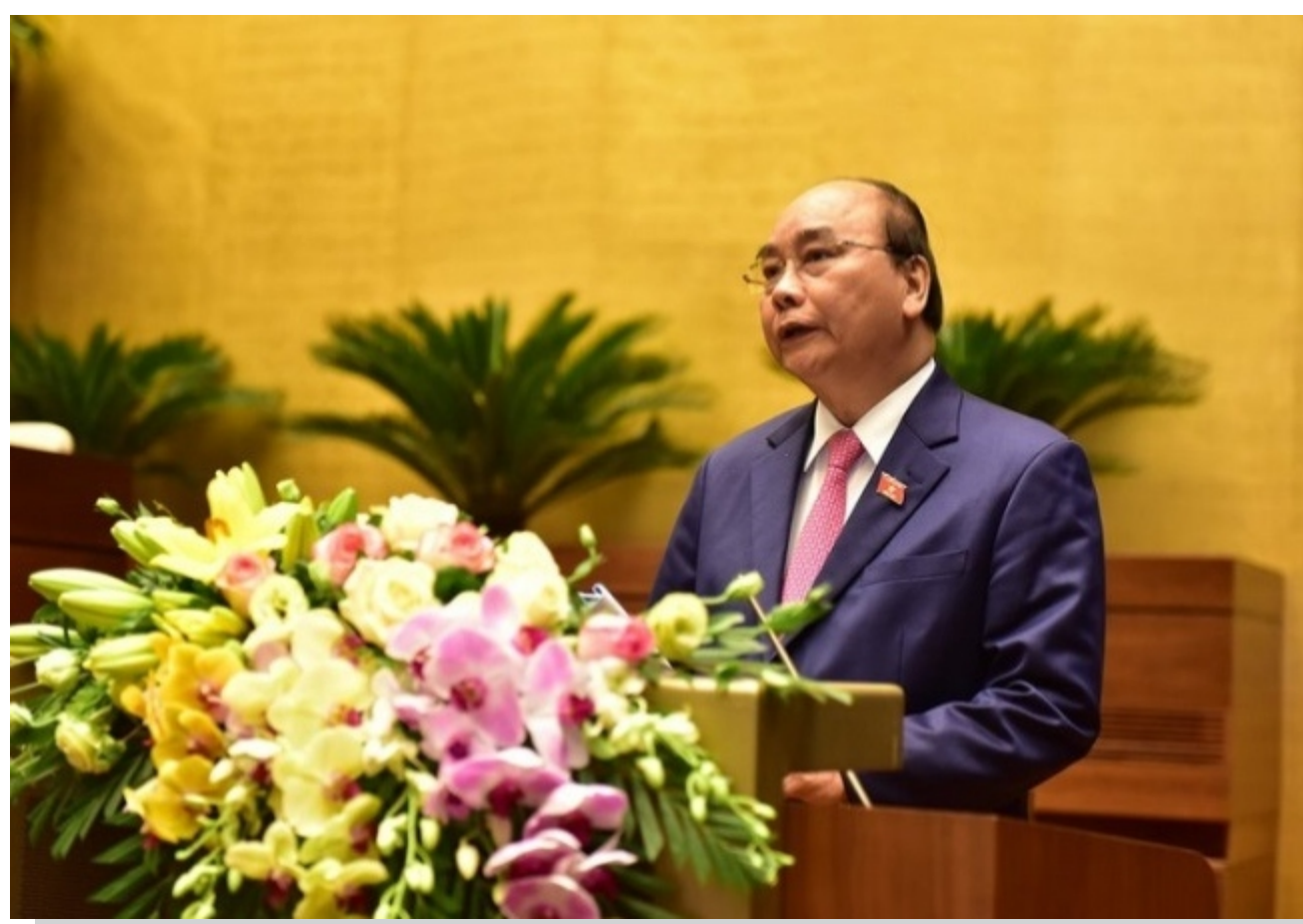
Thủ tướng Chính phủ trình bày báo cáo tại phiên Khai mạc.

Thủ tướng đề cập đến những kết quả nổi bật của nền kinh tế như: Tăng trưởng kinh tế đạt khá cao, năng suất lao động và chất lượng tăng trưởng tiếp tục được cải thiện; kinh tế vĩ mô ổn định vững chắc hơn. Tốc độ tăng GDP cả năm ước đạt trên 6,8%, thuộc nhóm các nước tăng trưởng cao hàng đầu khu vực, thế giới. Kết quả này thể hiện nỗ lực, cố gắng rất lớn của các cấp, các ngành và cả nước trong khi khu vực nông nghiệp chịu ảnh hưởng bất lợi của dịch tả lợn châu Phi và nắng nóng, hạn hán; giá nhiều nông sản giảm mạnh; thị trường xuất khẩu nhiều mặt hàng chủ lực gặp khó khăn.