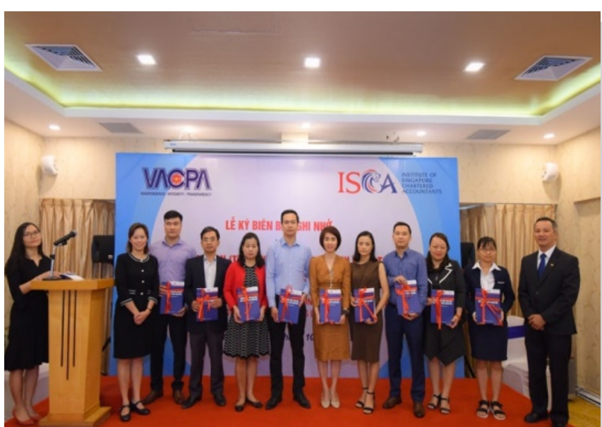
Lãnh đạo 2 Hội trao tặng sách cho Hội viên tổ chức VACPA