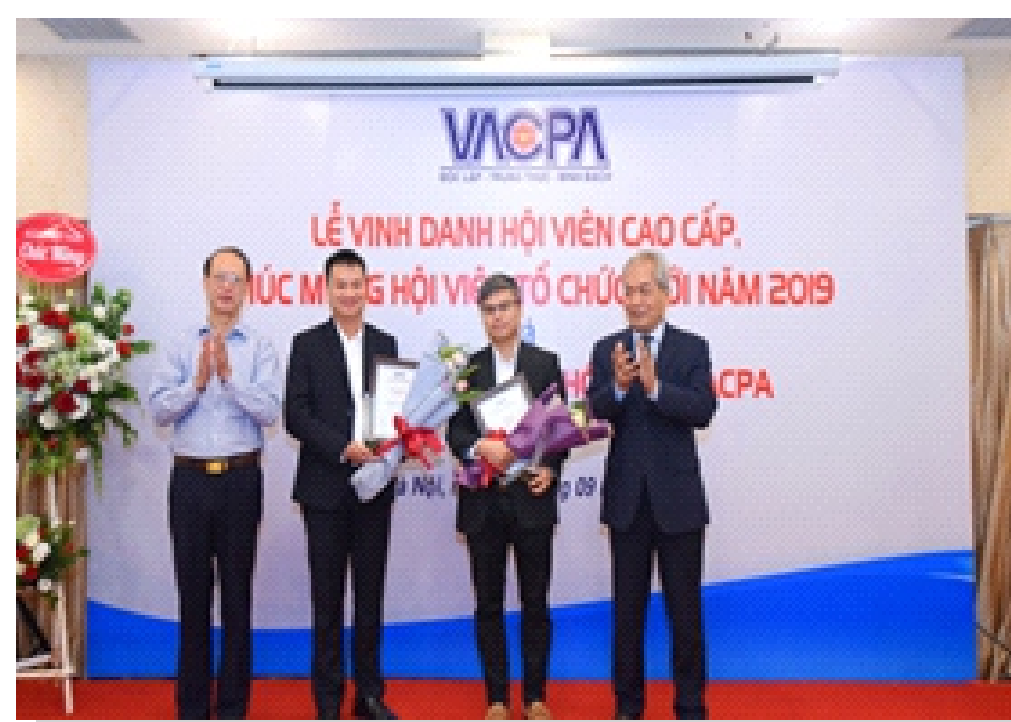
Hội viên cao cấp VACPA năm 2019