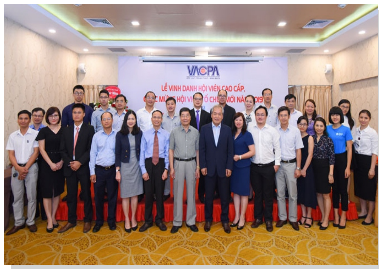
Các đại biểu chụp ảnh lưu niệm tại buổi Lễ