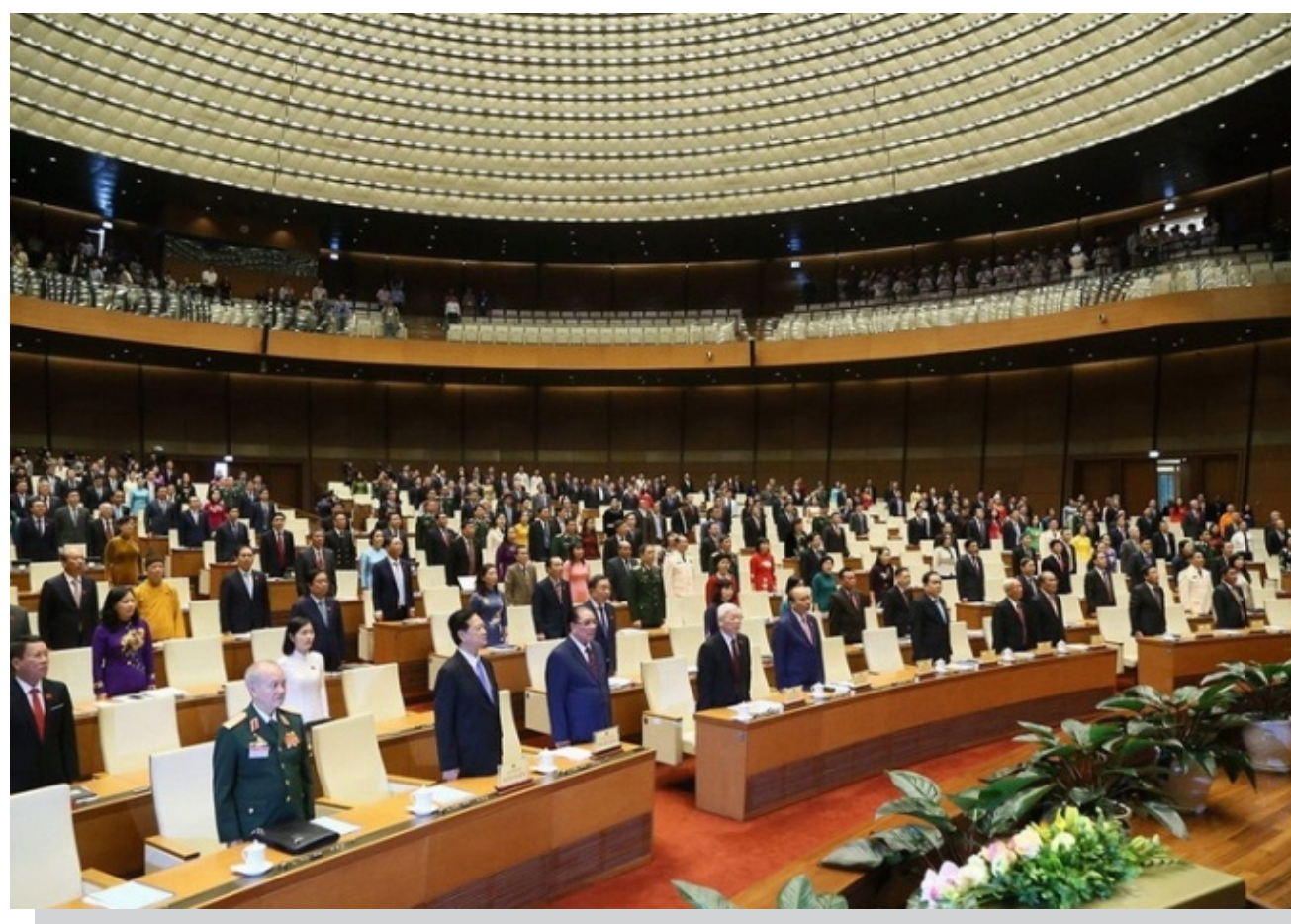
Lãnh đạo, nguyên Đảng, Nhà nước tham dự phiên Khai mạc.

Chính phủ chỉ đạo tập trung rà soát, hoàn thiện cơ chế, chính sách, đưa ra định hướng, giải pháp tạo động lực phát triển các ngành, lĩnh vực trọng yếu của nền kinh tế. Nhờ sự vào cuộc quyết liệt của toàn Đảng, toàn dân, toàn quân, dự kiến chúng ta sẽ hoàn thành toàn diện các mục tiêu phát triển KT-XH năm 2019, là năm thứ 2 liên tiếp đạt và vượt toàn bộ 12 chỉ tiêu chủ yếu, trong đó 5 chỉ tiêu vượt kế hoạch. Tăng trưởng kinh tế vượt mục tiêu đề ra trong khi vẫn duy trì ổn định kinh tế vĩ mô vững chắc hơn, lạm phát được kiểm soát tốt và các cân đối lớn của nền kinh tế được củng cố, mở rộng. Đời sống của nhân dân trên mọi miền đất nước đều chuyển biến rõ nét. Thể và lực của ta không ngừng được củng cố; uy tín quốc tế được nâng lên.