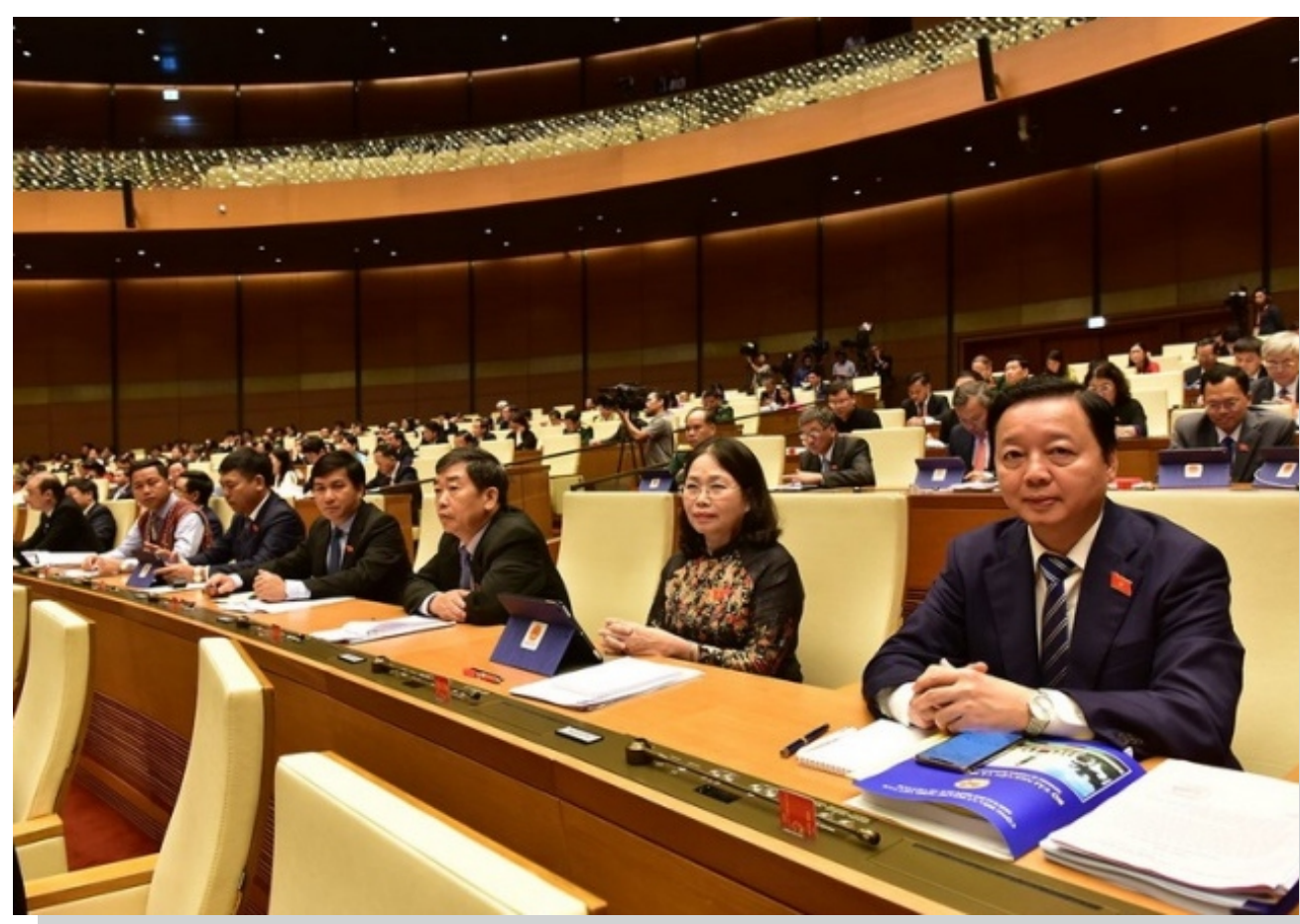
Đoàn ĐBQH Bà Rịa - Vũng Tàu tại phiên khai mạc.