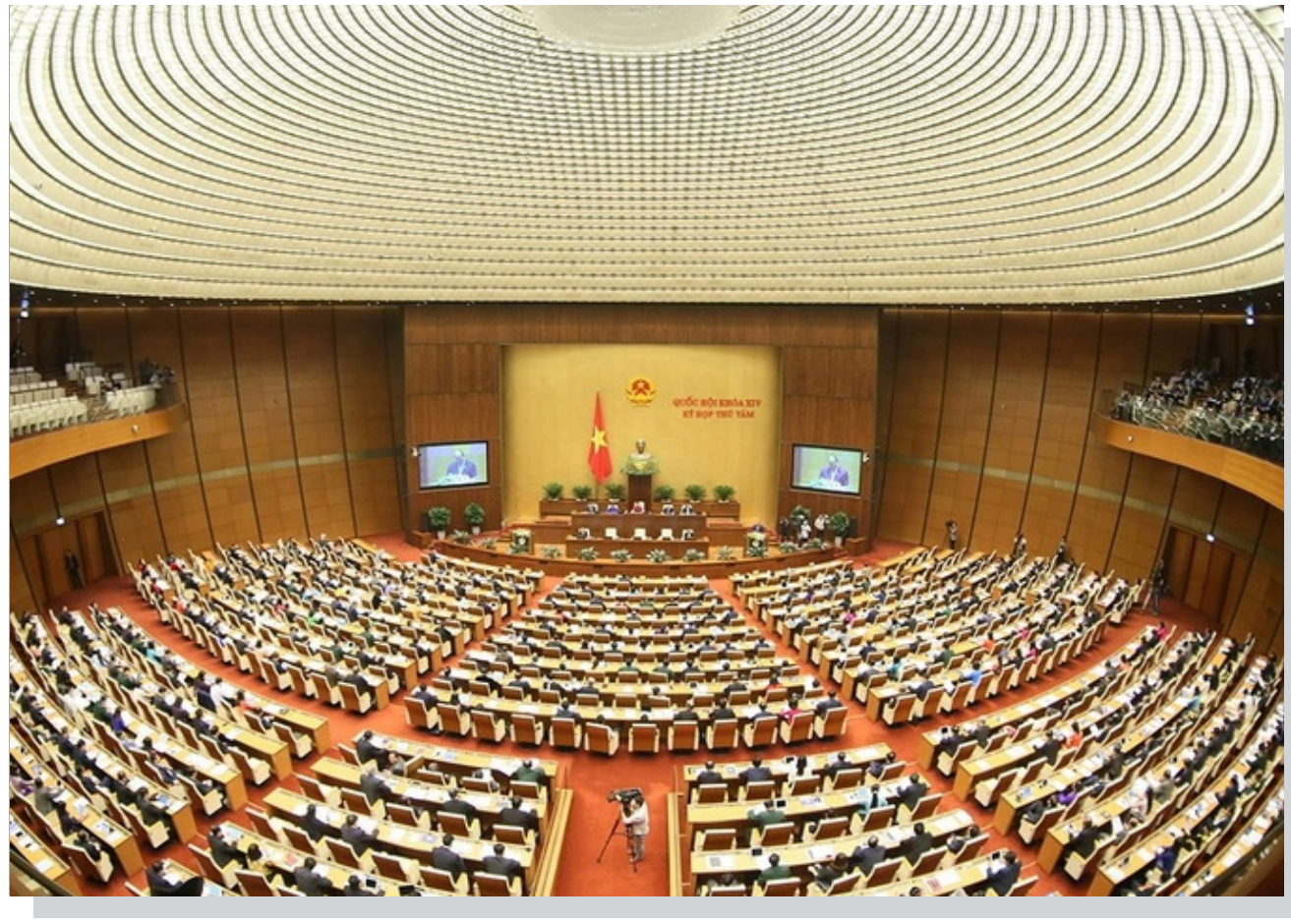
Toàn cảnh phiên khai mạc.

Về môi trường: Tỷ lệ khu công nghiệp, khu chế xuất đang hoạt động có hệ thống xử lý nước thải tập trung đạt tiêu chuẩn môi trường đạt 90%; tỷ lệ che phủ rừng đạt 42%.